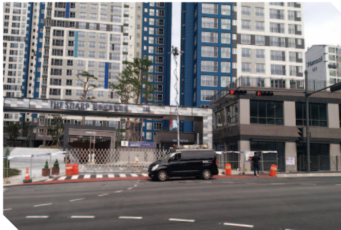
〈신축아파트 준공허가(방송시스템) 전파환경 수탁 측정〉